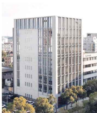
WDBホールディングス 本社ビル

住所 姫路市豊沢町79 (WDBホールディングス本社ビル内) TEL:079 (283) 1771 FAX:079 (283) 5188