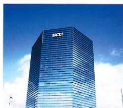
ポーアイ 本社ビル