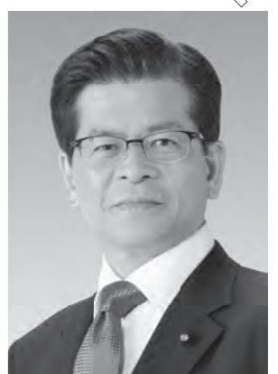
公明党代表 石井 啓一