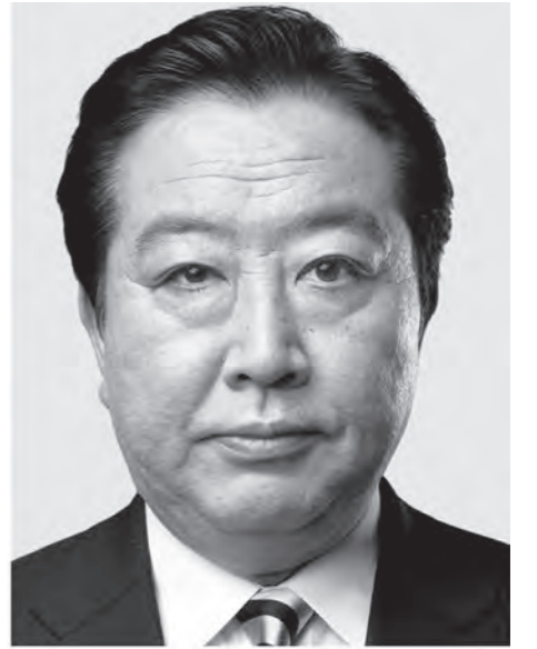
立憲民主党 代表 野田佳彦