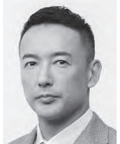
れいわ新選組 代表 山本太郎