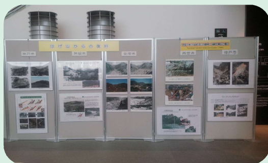
パネル展示及び映像等のモニター上映 昭和13年・42年の豪雨災害や、平成7年阪神・淡路 大震災の被害・復旧状況等をパネルや映像で紹介します