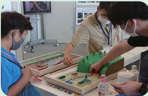
土砂災害小型模型 土石流や崖崩れ、地すべりについて模型で学ぶことができます