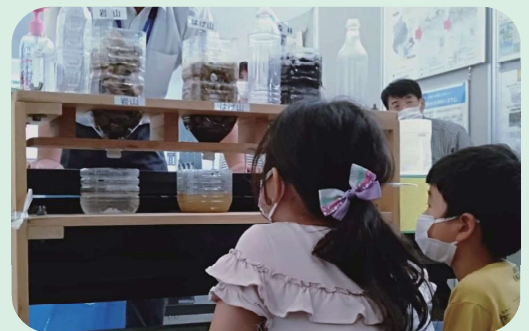
森林の浸透機能の比較実験装置 森林の保水機能を確認できます