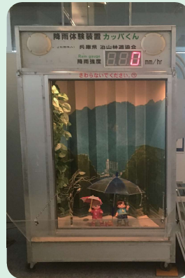
降雨体験装置 カップくん 雨量の違い（小雨（10mm/hr）～ 豪雨（100mm/hr））を感じていただけます