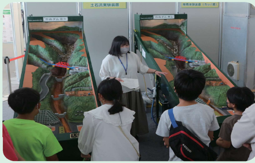
土石流模型実験装置 土石流の怖さや治山ダム役割が体感できます