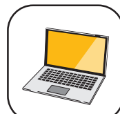
パソコンスキルアップ