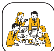
コミュニケーション