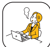
ストレスマネジメント