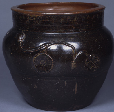
— 黒 —