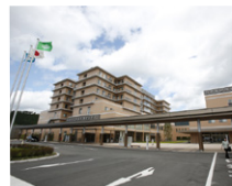
▲ 丹波医療センター