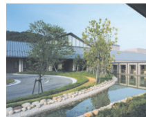
▲ 粒子線医療センター