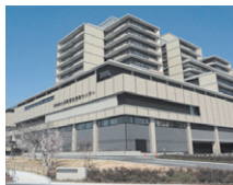
▲ 尼崎総合医療センター