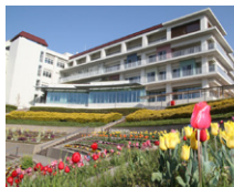
▲ ひょうごこころの医療センター