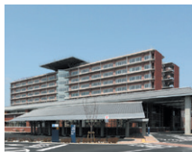
▲ 淡路医療センター