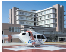
▲ 加古川医療センター