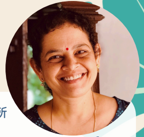
国連大学サステナビリティ高等研究所 リサーチフェロー

2019年まで佐渡市役所職員として奉職。2008年に佐渡米の「朱鷺と暮らす郷認証制度」を確立し、2011年には日本で初となる世界農業遺産の認定に貢献。農林水産課長、総務課長、総合政策課長等を歴任。2020年より現職。