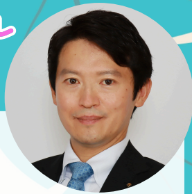
兵庫県知事 齋藤 元彦 氏

1977年兵庫県神戸市生まれ。東京大学卒業後、総務省に入省。省内勤務をはじめ新潟県佐渡市、福島県飯舘村、宮城県庁、大阪府庁と数々の地方自治を経験。2021年8月兵庫県知事（第53代）に就任。