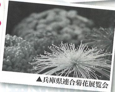
▲兵庫県連合菊花展覧会