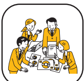
コミュニケーション