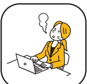
ストレスマネジメント