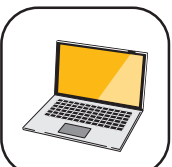
パソコンスキルアップ