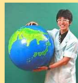
らんま先生 eco実験 パフォーマンス