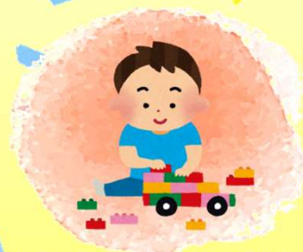
知育ブロックを使った作品づくり