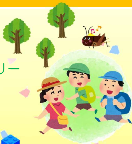
こどもの館ウォークラリー