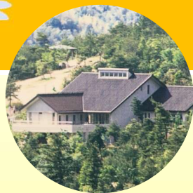
森のウォークラリー (自然観察の森)