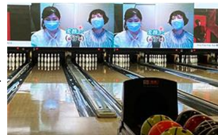
ボウリング大会の様子

上記のほか、二次健診(再検査)等の受診費用補助、対象者全員の受診必須化、スマホアプリを使用したウォーキングイベントの実施、残業時間削減、労働時間に対する生産性の高い事業所の社内表彰