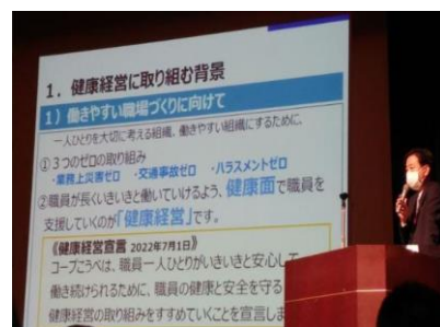
担当役員による取組の説明