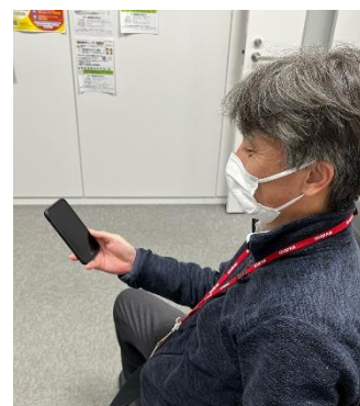
サポートプログラムを利用する職員

上記の他、パート職員を含めた定期健康診断・精密検査受診・ストレスチェックの実施など様々な取組を実施