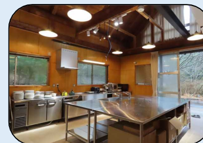
【キッチンスタジオ1階】