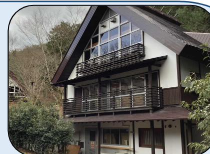
【コワーキングスタジオ】