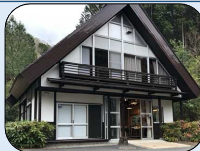
【キッチンスタジオ】