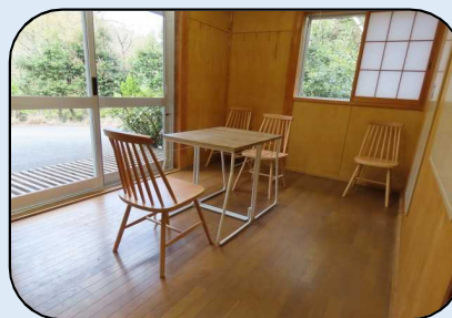
【キッチンスタジオ1階 ダイニングルーム】