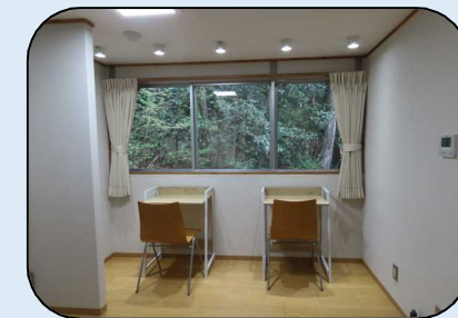
【コワーキングスタジオ 1階個別スペース】