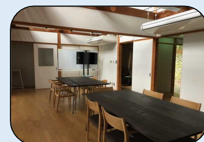
【コワーキングスタジオ 2階共有スペース】