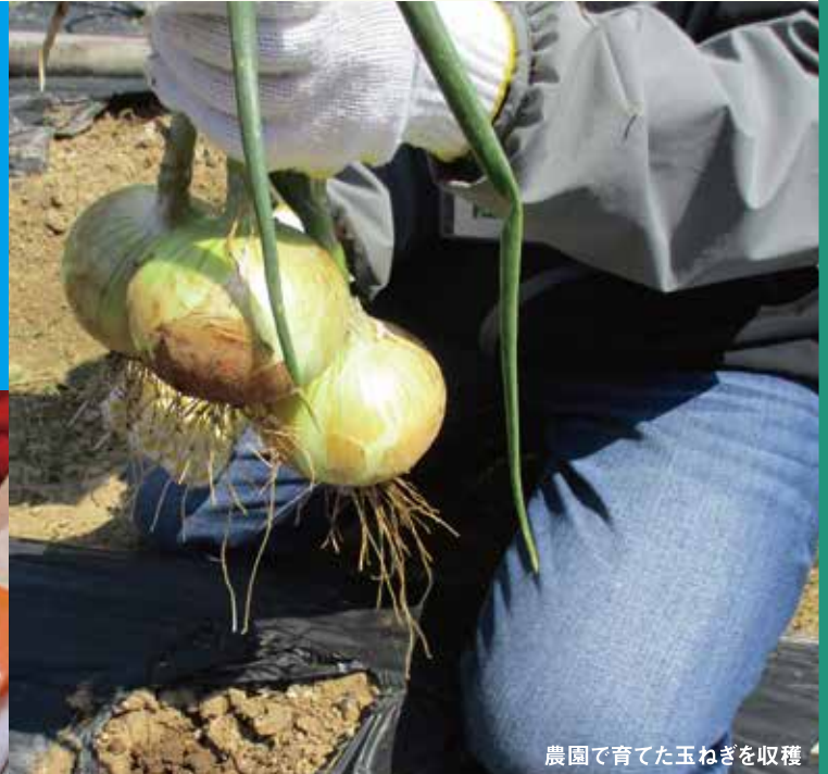
農園で育てた玉ねぎを収穫