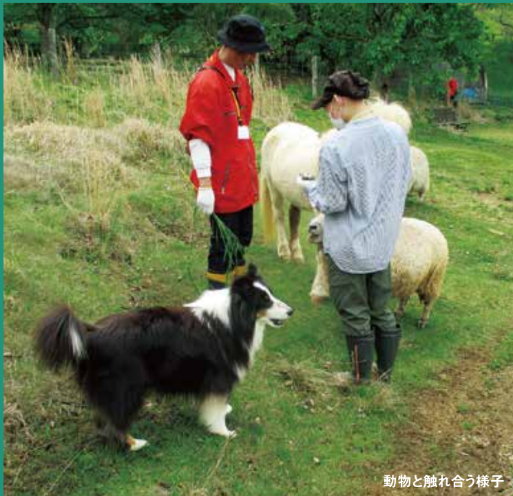
動物と触れ合う様子