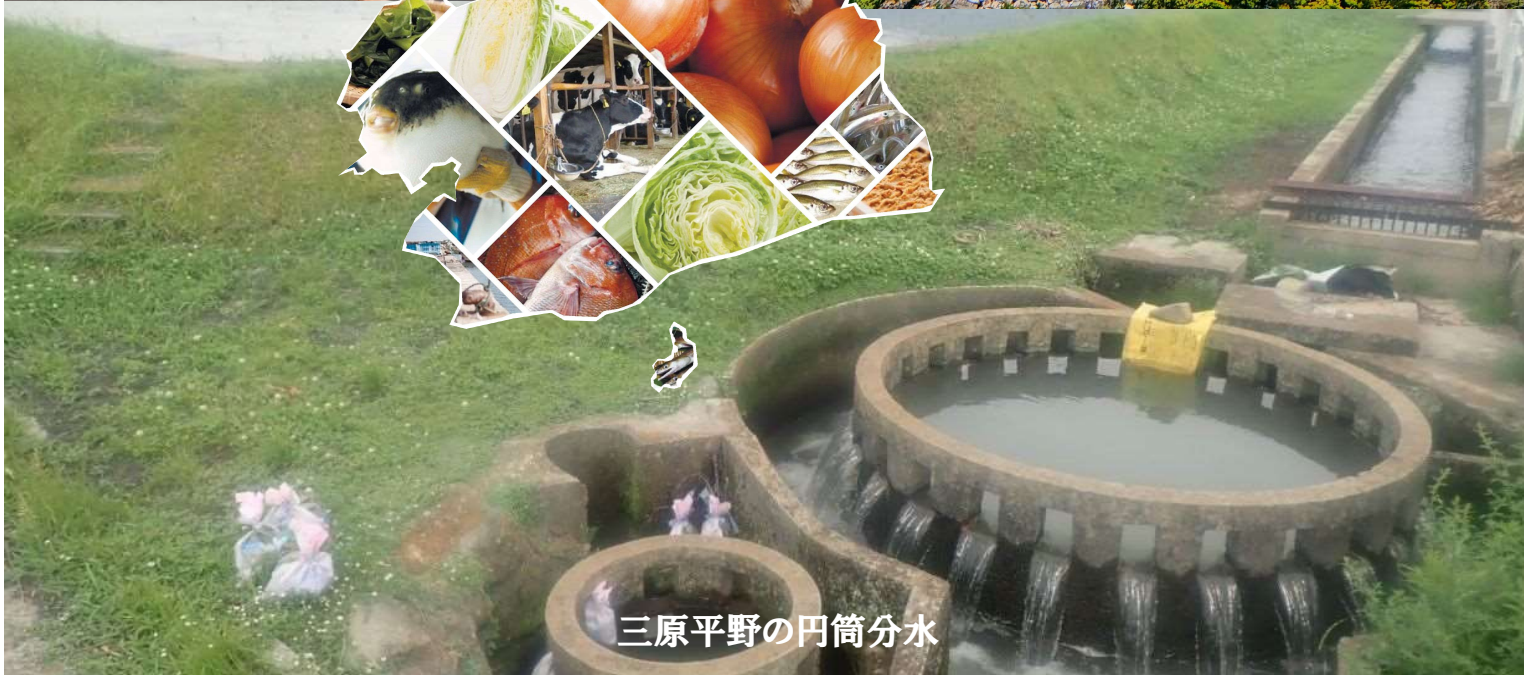
三原平野の円筒分水