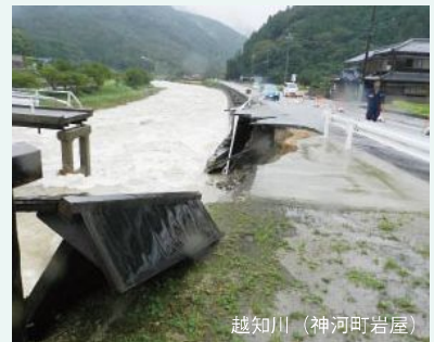
越知川（神河町岩屋）