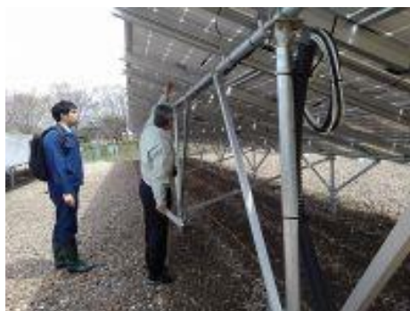
太陽光発電設置相談

ホームページ： http://www.eco-hyogo.jp/global-warming/center/saisei