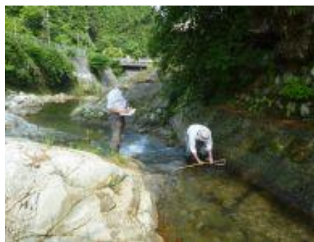
小水力発電設置相談