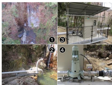
小水力発電所（神戸市灘区六甲川）