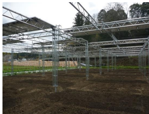
営農型太陽光発電（ソーラーシェアリング） （宝塚市内） [H27 無利子貸付 採択]