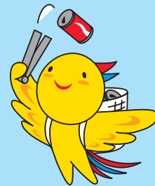
兵庫県マスコットはばタン