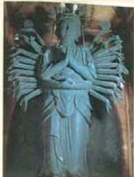
横倉山観音堂の千手観音像

中世戦国時代(鎌倉時代や室町時代)の山城としての歴史をもち、山頂の本丸跡や井戸跡などの遺構をみることができる里山です。また、横倉山観音堂や四国八十八箇所霊場石仏群などの歴史的な景観を楽しむことができます。