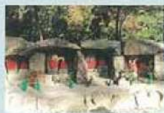
四国八十八箇所霊場石仏群