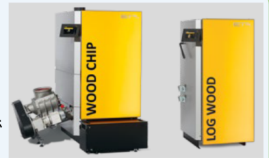
↑木質バイオマスボイラー

徳島地域エネルギーでは、再生可能エネルギーの普及と事業化を担っており、これまで太陽光発電12か所、小水力発電1か所をコーディネートしました。2015年からは、木質バイオマス熱利用を推進するため、全国18か所でボイラー施設の導入を支援しました。現在は、北摂地域の里山を活用し、燃料づくりから施設設置まで一貫した取組を行っています。