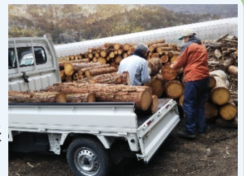
↑間伐材の有効活用

バイオマス丹波篠山では、森林の間伐や里山整備を進め、丹波篠山にきれいな山なみを蘇らせようとしています。そして、搬出された木の利用を、木質ペレットや薪、組手什(くでじゅう)や割り箸など多方面に広めています。篠山の未来ある子供たちのため、木の地産地消による地域づくりと、美しい里山に囲まれた環境づくりに、関係諸団体と連携を取りながら貢献します。