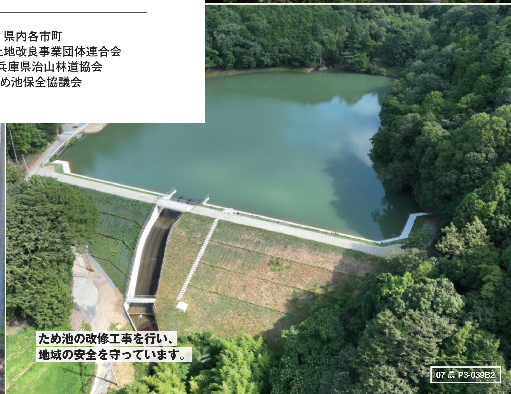
ため池の改修工事を行い、 地域の安全を守っています。