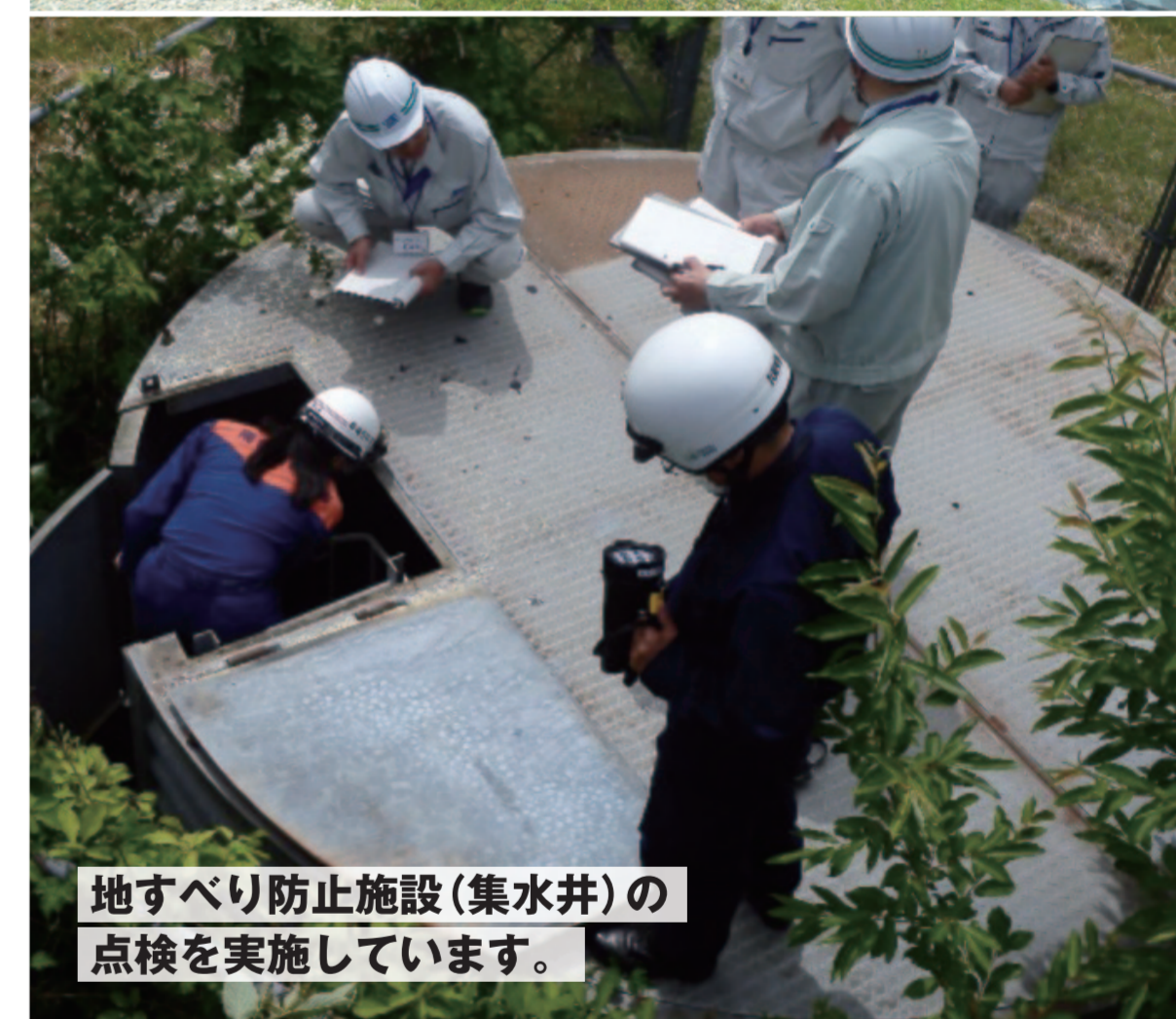
地すべり防止施設(集水井)の 点検を実施しています。

大雨時に土砂が流れ出すのを 防いだり、山を保全するために 治山ダム工事を実施しています。