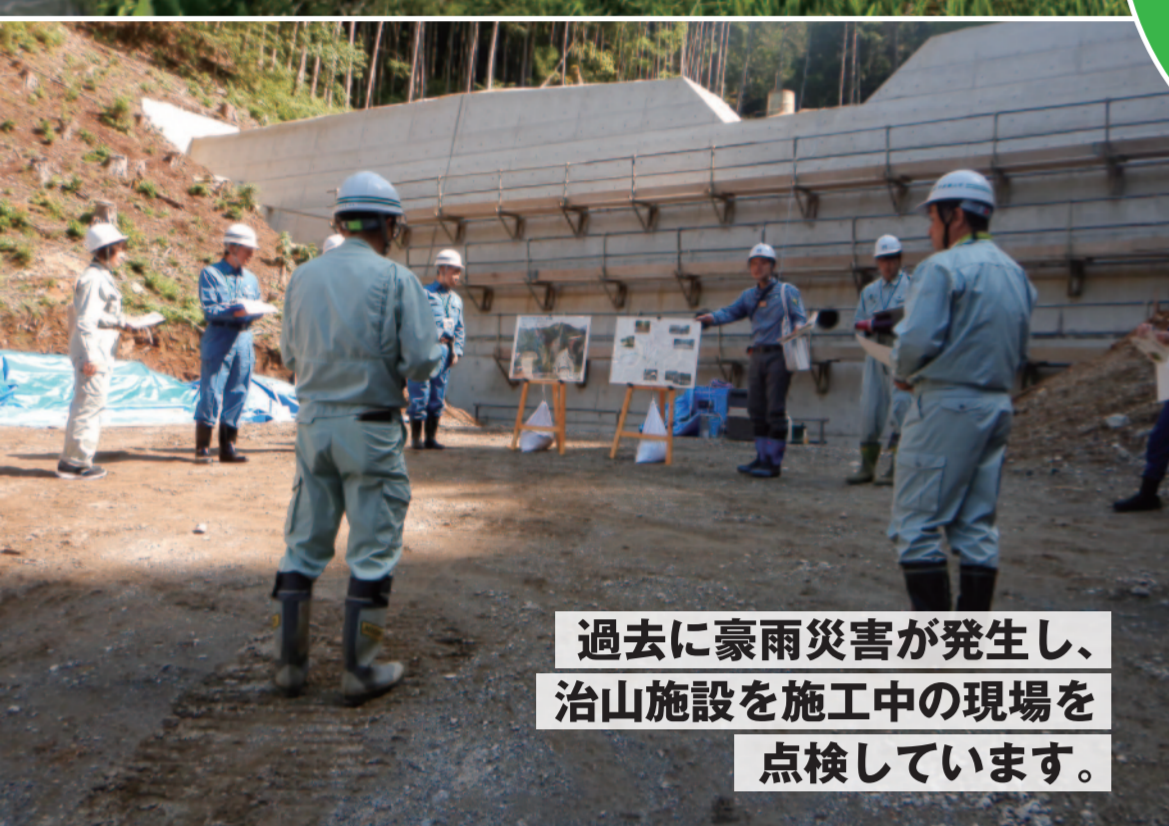
過去に豪雨災害が発生し、 治山施設を施工中の現場を 点検しています。