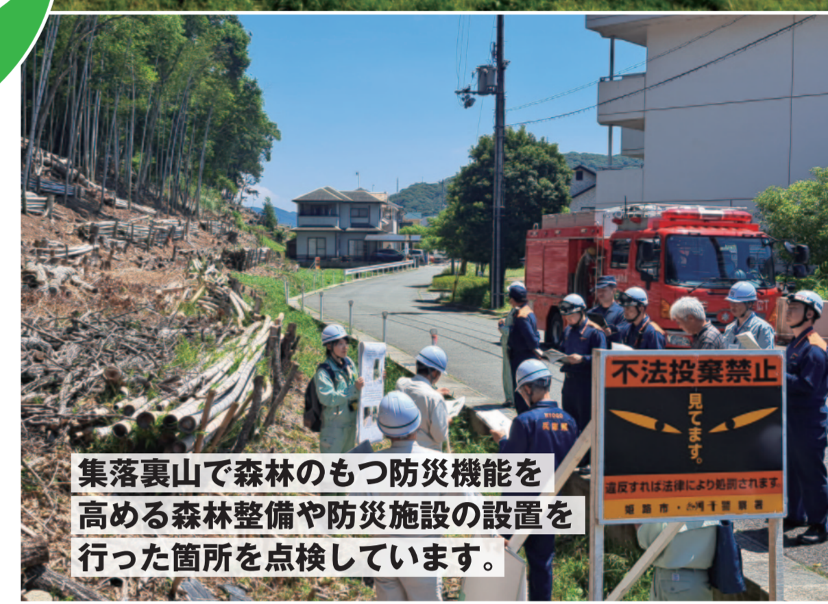
集落裏山で森林のもつ防災機能を 高める森林整備や防災施設の設置を 行った箇所を点検しています。