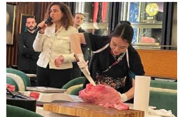
和牛マスター輸出拡大コンソーシアムによるカットデモンストラーション（ミラノ）

なお、令和5年度は、三田食肉センターからサウジアラビアへの輸出が急増するなど、神戸ビーフの輸出量は68.5tに上り、今や世界42カ国・地域で食されている。