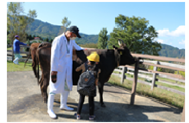
プログラムによる但馬牛のブラッシング体験(県立但馬牧場公園)

特に、同公園内の但馬牛博物館では、国内の畜産分野で初めて世界農業遺産に認定された「人と牛が共生する美方地域の伝統的但馬牛飼育システム」について学ぶことができる。