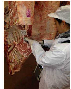
モノ不飽和脂肪酸の測定