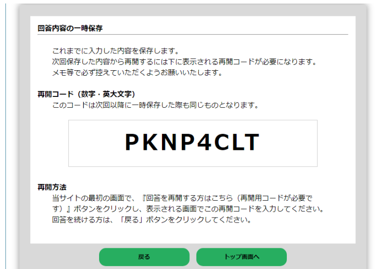
【図 1 4】