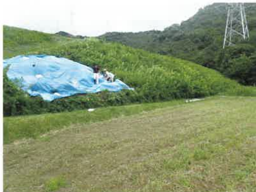
猪によるため池堤体の被害