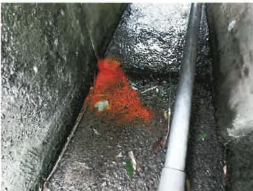
色粉を投入し、漏水箇所を確認

③取水施設からの漏水 取水孔を閉じているにもかかわらず、底樋の出口から水が流れていました。水位を落とすから調査した結果、取水孔の操作ハンドルを全閉にしても、曲がりがもたらなかった結果、曲がりもどらなくなってしまうことが原因とされています。操作ハンドルを全閉以上に閉じすぎると、操作される方は注意してください。