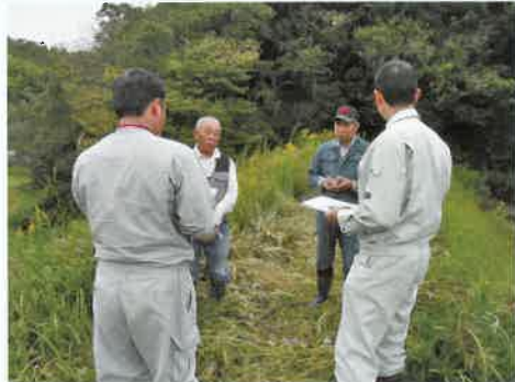
現地で説明を受けるため池管理者

大雨が降る前に取水施設などを利用し、ため池の水位を下げることで、洪水が堤防を越水することによる決壊リスクの低減や、下流の水路があふれて農地や住宅が浸水する被害を軽減することができません。