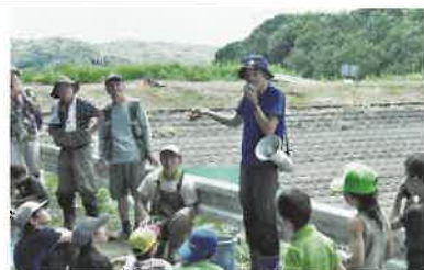
池に棲む生き物について解説

同じく9月7日、神戸市西区押部谷町にある溝谷池にて、池を背景に参加者全員で記念撮影後、閉会となりました。池を背景に参加者全員で記念撮影後、閉会となりました。最後に、地元で収穫したタマネギ、ニラやカボチャなどの野菜を参加者に配布し、農村が農作物の供給にとどまらず、池や水路などの水利施設の保守を通じて自然環境保護に貢献していることへの理解を深める機会となりました。