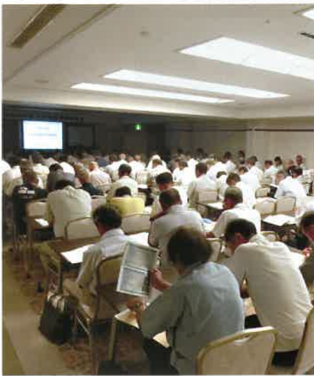
ため池管理者講習の開催状況