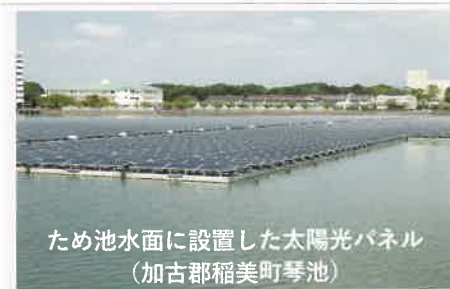
ため池水面に設置した太陽光パネル (加古郡稲美町琴池)