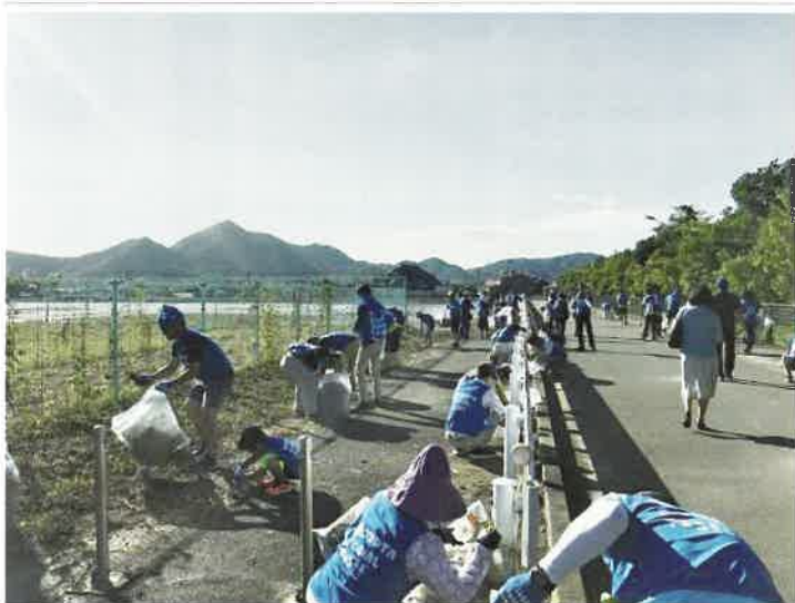
蓮池刈草を拾い集める

今回ご紹介する事例のように、ため池管理者のみではなく、地域住民の人たちが協力して、ため池の清掃活動を行うことをお勧めします。ぜひ、参考にしてみてください。