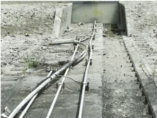
曲がってしまったスピンドル