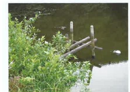
老朽化で取水、放流ができなくなった木樋

県では、取水施設が老朽化等により機能せず、ため池の水位を下げる対象に、堤防上め池を対象に、堤防上塩化ビニル管のサイフォン等を設置し、放