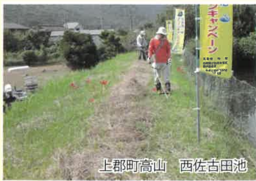
上郡町高山 西佐古田池

兵庫県では、「ため池の保全等に関する条例」に基づき、ため池や疏水の適正な管理や多面的機能の発揮の促進に向けた取組を、県民一人ひとりがそれぞれの立場で実践していくことを「ため池保全県民運動」として展開しています。「ため池クリーンキャンペーン」もこの一環として実施しています。 平成29年度のため池クリーンキャンペーンは、県内33市町、延べ465箇所で開催され、約1万2千人が参加しました。本年度も、10月に実施します。ため池管理者におかれましても積極的な取り組みをお願いします。