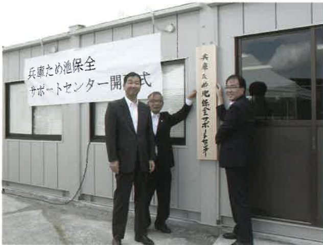
兵庫ため池保全サポートセンターが業務開始

増加し、整備がさらに長期化する恐れもあります。このため、ため池管理者自らによる管理対策（水位低下、簡易な補修等）をより強化にし、整備に着手するまでの安全・安心を確保する対策が急務となっています。