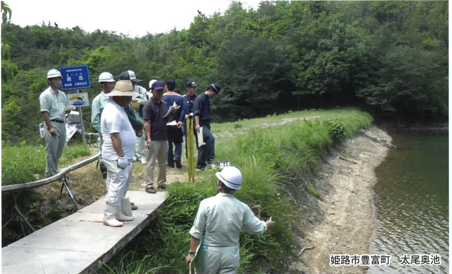
姫路市豊富町 太尾奥池