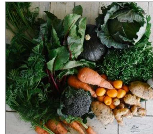
※CSA野菜セット（イメージ）