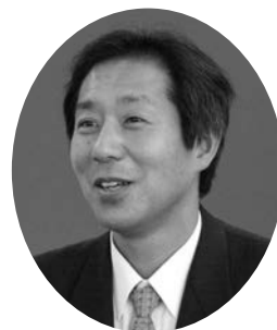
講師プロフィール