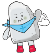
太子町マスコットキャラクター ぼうじい