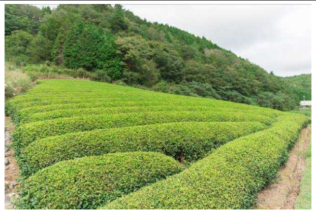
↑ 管理の行き届いた茶畑