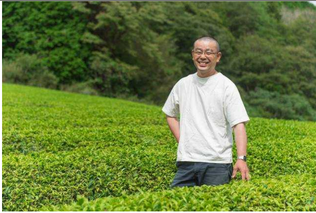
↑ 社長は 44 歳