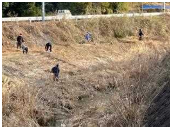
河川の草刈りの様子