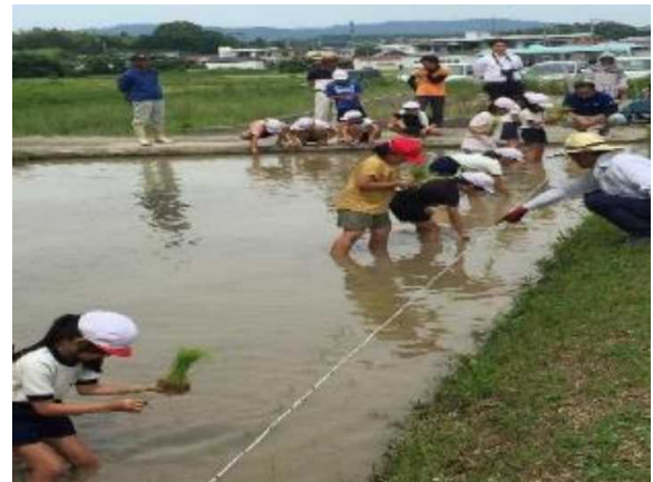
小学生の田植え体験の様子