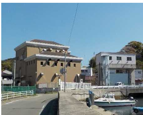
赤坂排水機場・水門（家島漁港）

播磨地域は祭りの盛んな地域です。農林水産業と地域の伝統文化は密接に結びつき、古来から豊作や豊漁を祈願して様々な祭りや行事が引き継がれており、伝統文化の伝承を通じて、地域内で世代を超えた交流が行われるとともに、外部との交流が図られ、地域の活性化に貢献しています。