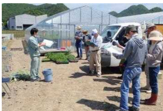
本格的な農業にチャレンジする講習付き農園(姫路市)