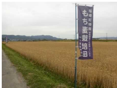
福崎町特産のもち麦栽培ほ場

今後も、中播磨農業を維持し、さらに活性化していけるよう、優良農地を守りつつ消費地に近接した立地を最大限に生かし、地域の事情に適した技術の導入、担い手の確保・育成に取り組む必要があります。