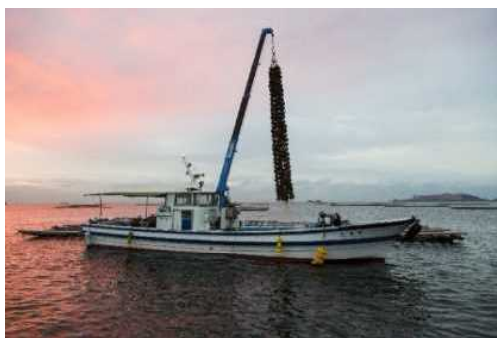
カキ養殖の操業状況

内水面においては、アユ釣りやアマゴ釣り等の遊漁が盛んに行われており、今後も河川等の豊かな自然や機能を保全していくことが必要です。