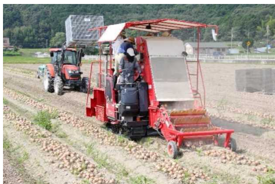
大型機械によるたまねぎの収穫作業

※ 「人・農地プラン」は、令和5年4月の改正農業経営基盤強化促進法により法定化され、「地域計画」として内容が見直されたことから、上表はR5以降の計画値は参考値となります。