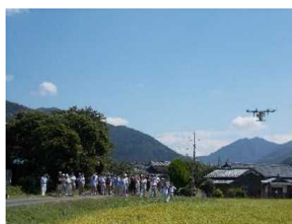
スマート農業研修会（神河町）