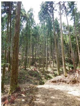
搬出間伐が行われた森林と路網整備 (姫路市)

適正な森林管理及び資源循環型林業を推進するためには、市町、森林組合、森林所有者等と連携して低コスト原木供給団地設定を促進し、林道・作業道等の路網整備及び高性能林業機械を積極的に活用し、生産コストの低減と原木の安定供給体制を確立する必要があります。