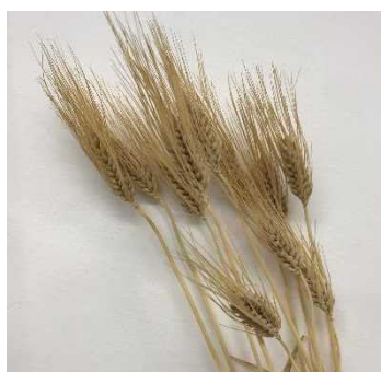
福崎町で生産する高βグルカン含量のもち麦新品種 「フクミファイバー」