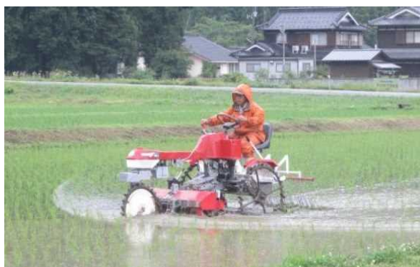
高性能水田除草機による機械除草