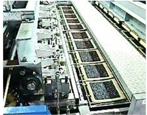
全自動のり乾燥機(明石市)

持続的な漁業の実現のため、収益性の向上と適切な資源管理の両立に向けた取組や複合経営を目指す漁業者などに、漁船やエンジン・漁具等をリースし、設備投資にかかる負担を軽減して、沿岸漁業の収益性の向上を図ります。