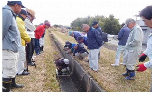
地域ぐるみの施設維持保全活動 (加古川市：上西条地域環境保全協議会)

また、高齢化が急速に進行する農村集落の将来の課題や姿を明らかにするため、あらゆる機会を捉えて多様な構成による集落の話し合いが進められるよう、誘導します。