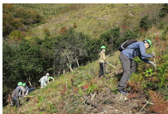
森林ボランティアによる森林整備 (高砂市)

また、地域住民が自然災害に的確に対応できるよう、平時から山地災害に関する研修会の開催や普及啓発を進めるとともに、地域住民やボランティアによる自発的な「災害に強い森づくり」活動を積極的に支援します。