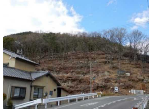
里山林の整備（高砂市）

東播磨地域の森林は4,244haで森林率は16%に止まり、兵庫県全体の森林率67%と比べて大きく下回っていますが、当地域に住む人々の身近な憩いの場として利用されているだけでなく、新鮮な水や空気、緑の供給源として、また、災害に強く安全で快適な生活環境の創出に貢献するなど、様々な恩恵をもたらしています。こうした森林の恵みをこれからも分かち合うには、社会全体で森林を支える仕組みのもと、地域社会の人々が自ら森づくりを進める必要があります。