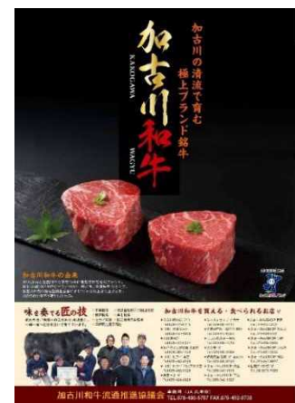
加古川和牛 PR ポスター