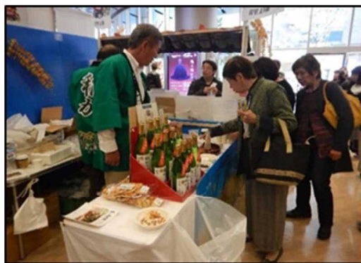
農産物加工品の試食、販売（大阪市）

水産物では、新しい生活様式に対応した需要喚起・販売促進を図るため、オンライン料理教室の開催や調理方法等の動画配信を推進します。