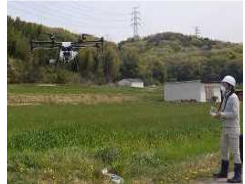
ドローンによる農薬散布（稲美町）

農業では、施設園芸における環境制御技術や水田圃場でのドローンによる防除等技術、直進性田植機などの普及を図ります。集落営農組織等に対しては、水稻栽培におけるG P Sによる直進性自動田植機、麦等の土地利用型作物の病虫害防除に対するドローン等のスマート技術の活用を図り、省力化・効率化を推進します。また、酪農では省力化のため搾乳ロボットの導入を推進します。