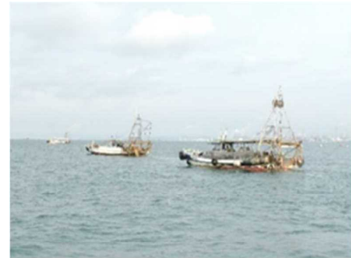
海底耕うん活動(明石市地先)

東播磨地域は、明石海峡から播磨灘に面し、明石市、播磨町、加古川市、高砂市の3市1町で漁業が営まれています。明石海峡は最速で7.5ノットにもなる早い潮流で複雑な海底地形を生みだし、一級河川加古川から流入する栄養豊富な水と砂が漁場を育んできました。そのため、鹿ノ瀬をはじめとした好漁場に恵まれ、船びき網漁業、小型底びき網漁業、ひきなわ漁業、五智網漁業やたこつぼ漁業等多様な漁業種類により、シラス、イカナゴ、マダコ、マダイ、カレイ類やアナゴなど様々な水産物が水揚げされています。また、冬季にはノリ養殖業が盛んに行われ、県下の約半分が東播磨地域で生産されています。