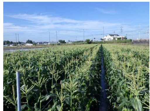
スイートコーン栽培（稲美町）