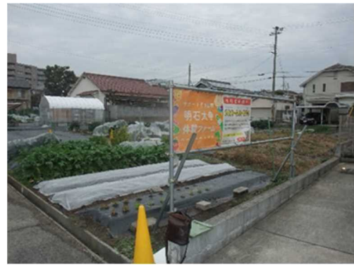
市民農園「明石太寺体験ファーム」

また、東播磨の都市近郊という立地を生かして、多様な開設主体による市民農園の整備や利用促進のため、ホームページなどによる市民農園情報の提供に努めます。