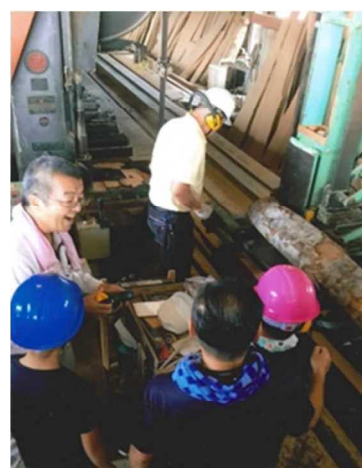
親子で学ぶ木工体験 (稲美町)

県産木材を利用することの大切さを幅広い世代に伝える「木育」の取り組みを地域の木育グループ等と連携しながら進めます。