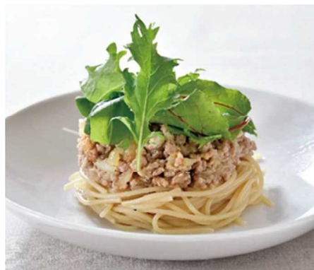
国産パスタ専用小麦による「加古川パスタ」

今後も、東播磨地域の農畜水産物を活用した新しい商品開発に向けて生産者と商工業者等との連携を図るとともに、比較的大消費地に近い利点を生かし、農家レストラン等、新しい販売先の確保を進めます。