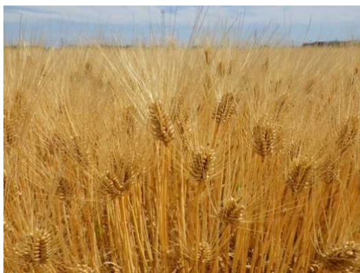
西日本有数の産地である大麦

また、活力ある地域の実現に向け、六次産業化による就業機会の増加や、海への栄養塩供給や漁場環境の改善による生産力の維持・増大、さらには、ため池・里山の防災機能の強化を進めます。