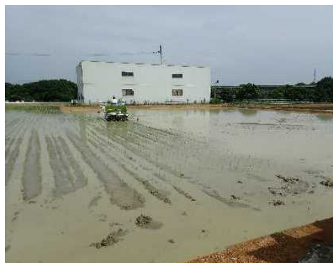
担い手による営農状況 (加古川市雁戸井地区)

施設の維持管理については、多面的機能支払制度等を活用して、地域の将来構想に合った持続可能な維持管理体制を確立し適正な管理を実施します。また、農業用水の管理等を通じて農業振興等に重要な役割を果たしている土地改良区については、組織の運営基盤強化に取り組みます。