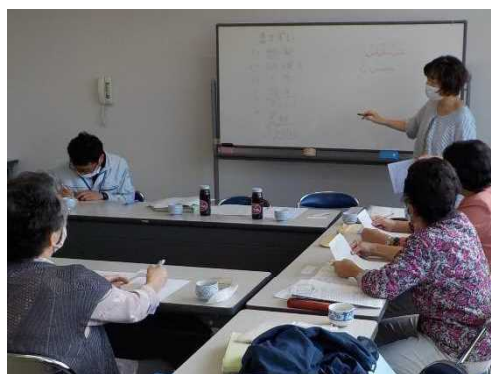
食品の安全安心にかかる講習会

また、より効果的にリスク管理できる貝毒監視体制の整備や、貝毒原因プランクトンの発生動向の把握等による、養殖のリスク低減手法を検討します。