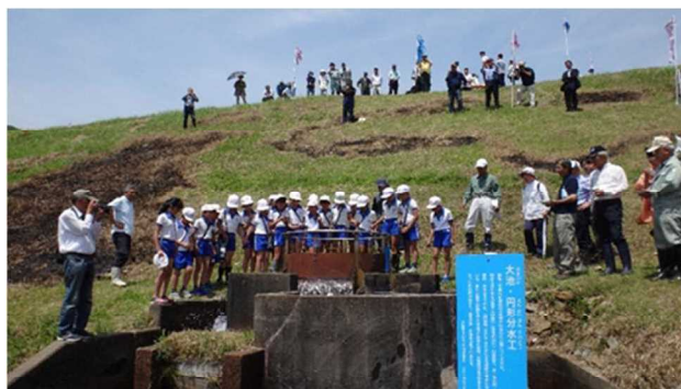
ため池伝統行事 樋抜の儀 (加古川市：原大池)

農漁村では農業集落排水、道路網、広場・公園等の整備が進み、快適で便利な居住空間が確保されつつありますが、今後とも活力があり、安全で安心して暮らせる農漁村づくりを推進する必要があります。