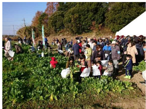
農業体験イベントの開催

地元の飲食店、観光協会などと連携した産地ならではの鮮度を生かした新たな水産物のメニューの提供や漁業体験施設や漁業生産施設等を活用した「見る・食べる・体験する」観光漁業など、マリンツーリズムの取組を支援し、漁業を核とした地域の活性化を推進します。