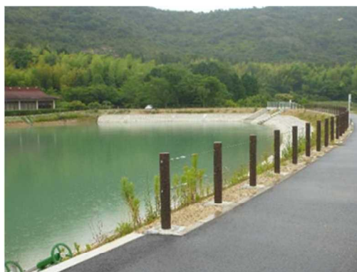
改修されたため池（高砂市）

今後とも、地域の貴重な財産であるため池や水路等の水辺を守り、生かし、次世代へ引き継いでいくために、これら水辺空間を活用した地域づくりである「いなみ野ため池ミュージアム」と連携して防災・減災対策を推進していきます。