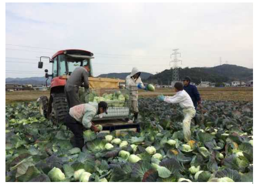
キャベツ収穫（加古川市）