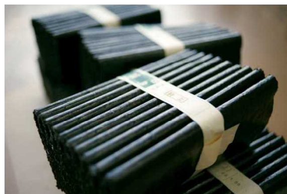
県内一の生産量を誇るノリ