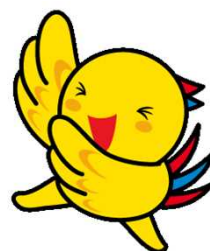
兵庫県マスコットはぼタン