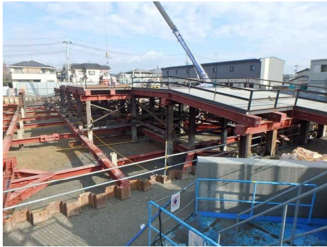
間の川ポンプ場建設状況