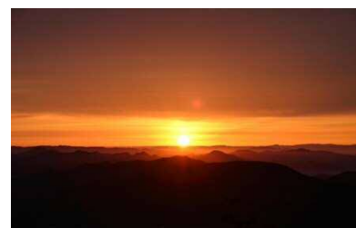
山頂から見るご来光