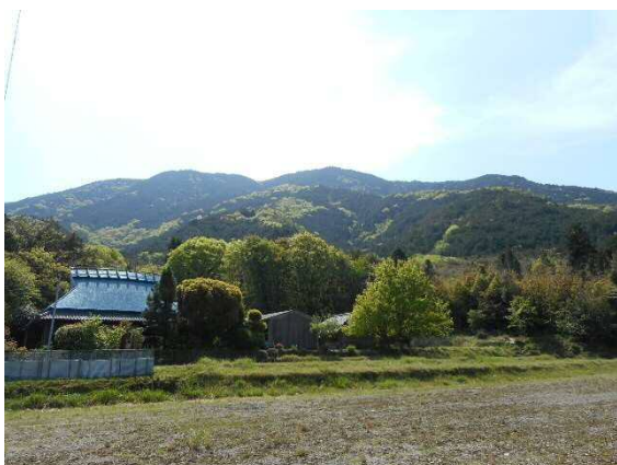
麓から頂上を望む