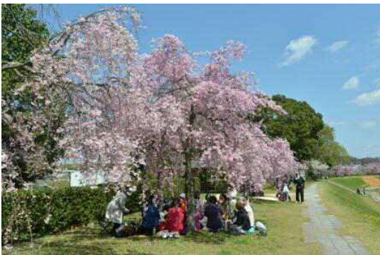
「桜の下で」 （残しておきたい“ふるさと北播磨” 写真コンテスト入賞作品）