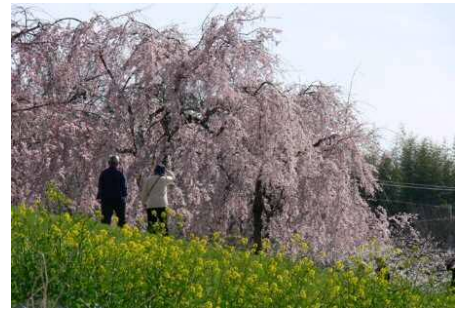
千鳥川沿いに咲く枝垂れ桜