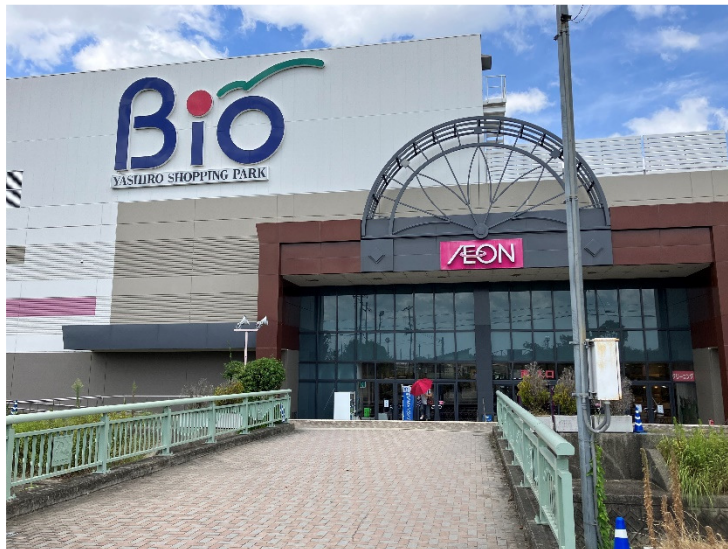
やしろショッピングパーク Bio

平成 8 年 5 月にオープンしたショッピングセンターである。イオン社店、専門店等の出店や事務所等が開設されている。イオン株式会社、社町ショッピングセンター協同組合、加東市、加東市商工会が株主である、やしろ商業開発株式会社が各店舗への賃貸、運営管理を行っている。