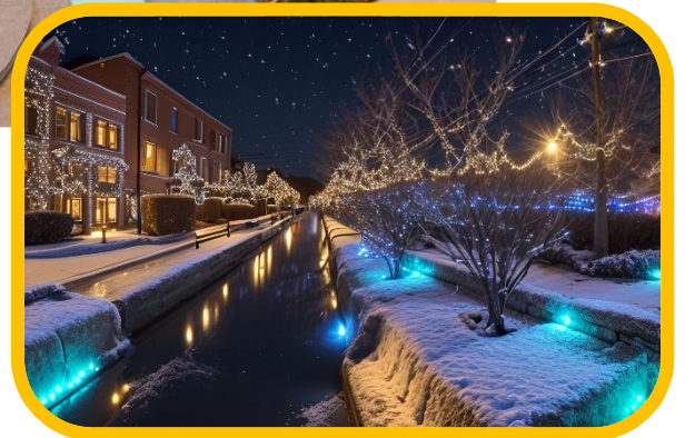
整備イメージパース