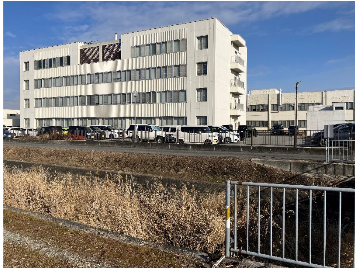
兵庫県社総合庁舎

県に10ある県民局・県民センターのひとつである北播磨県民局が入る支庁舎で、総務企画室、県民交流室、加東財務事務所、加東健康福祉事務所、加東農林振興事務所、加東土木事務所がある。建物は昭和56年に建築されており、43年が経過している。