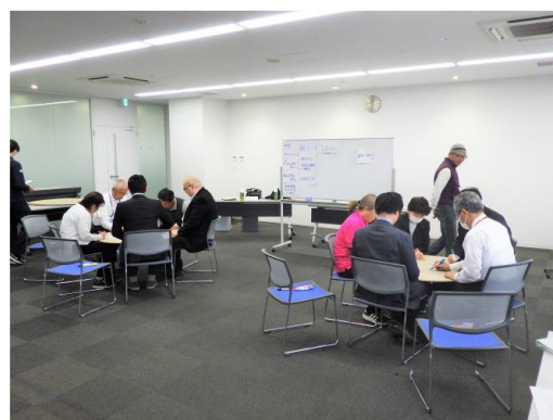
「えんたくん」を使用したグループワーク