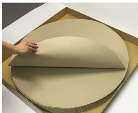
コミュニケーションツール「えんたくん」

3で決めた優先順位の高い順に6テーマを選び、グループワークを行った。このグループワークではコミュニケーションツール「えんたくん」を使用した。テーマに関連する事柄に関して自由に発言し、内容を「えんたくん」に書き記して、キーワードの抽出を行った。