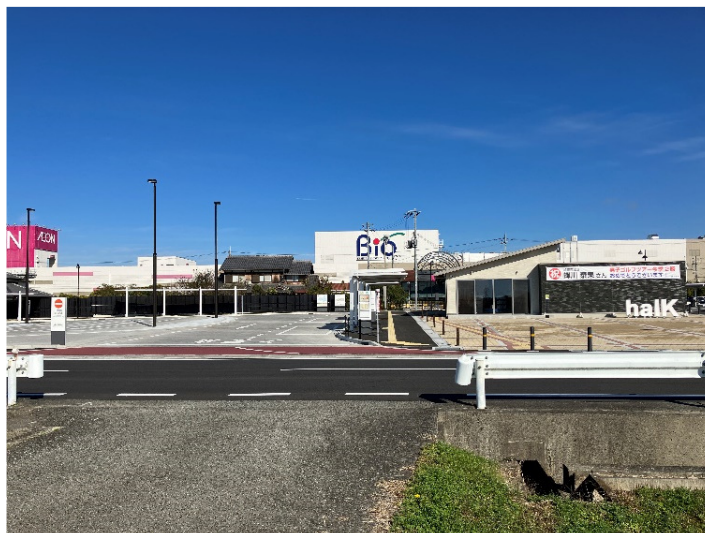
加東バスターミナルとにぎわい交流施設 halK

加東市の新たな交通結節点として、令和4年10月1日に供用開始した。路線バス・高速バスのほか、加東市乗合タクシー「伝タク」や自主運行バスが発着する。また、バスターミナル東側のパーク&ライド駐車場には、駐車スペース約100台分、駐輪スペース約60台分が設けられており、加東市の市内外への移動の拠点である。さらにターミナル東には「手打ちうどん孫心」「CINEMA COFFEE TERMINAL」「待合交流ラウンジ」が入る「にぎわい交流施設「halK（ハルク）」がある。