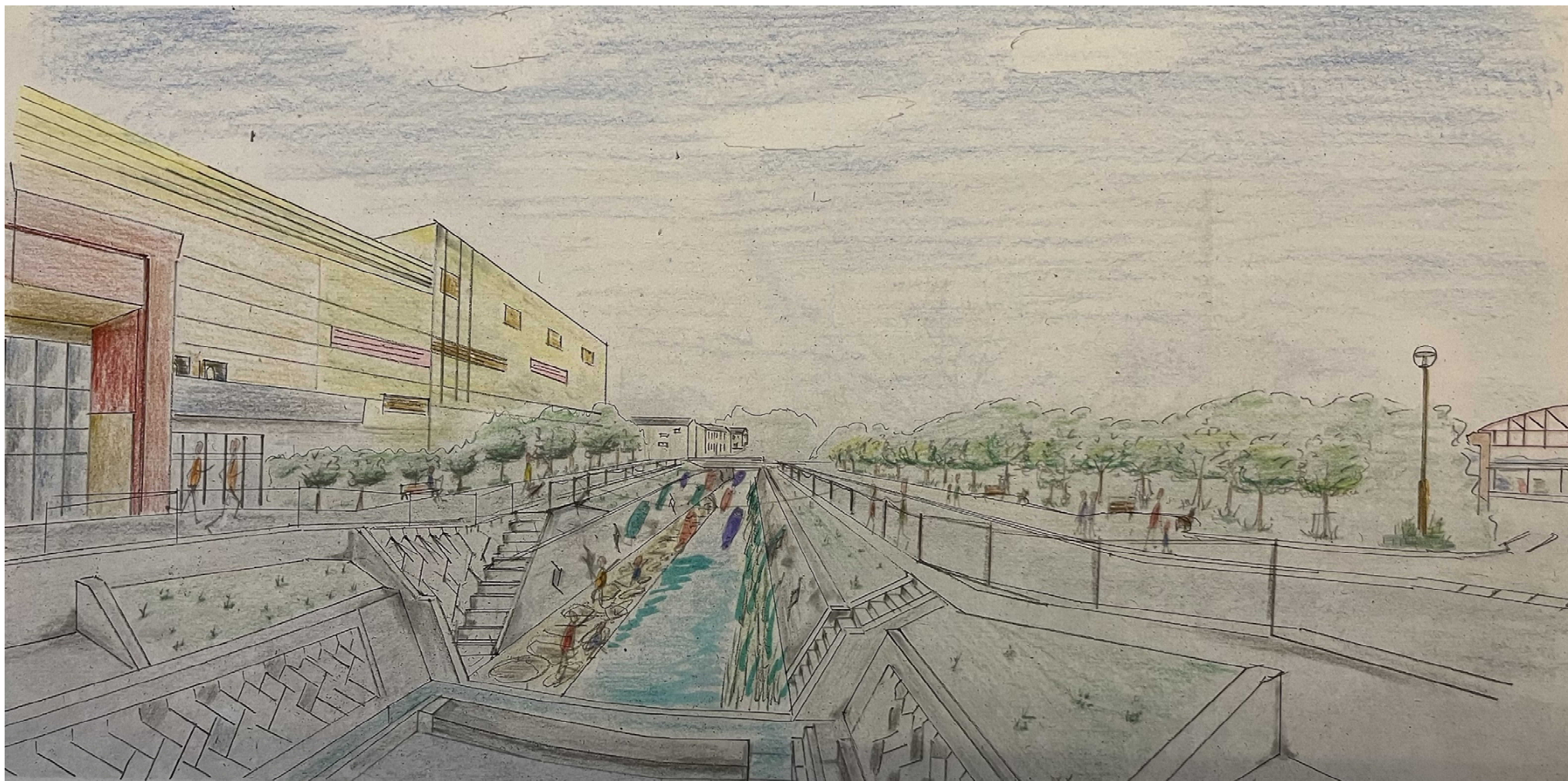
やしろショッピングパークBio前 下川屋のイメージパース(角谷委員 メモ)