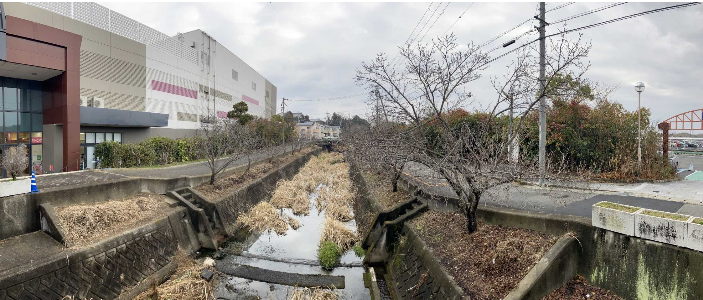
やしろショッピングパークBio前 下川現況写真