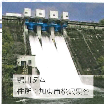
鴨川ダム 住所：加東市松沢黒谷