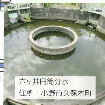
六ヶ井円筒分水 住所：小野市久保木町