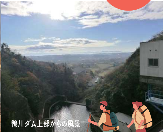
鴨川ダム上部からの風景