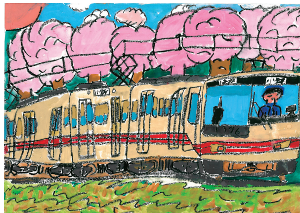
「景色のいい所を走る神戸電鉄」