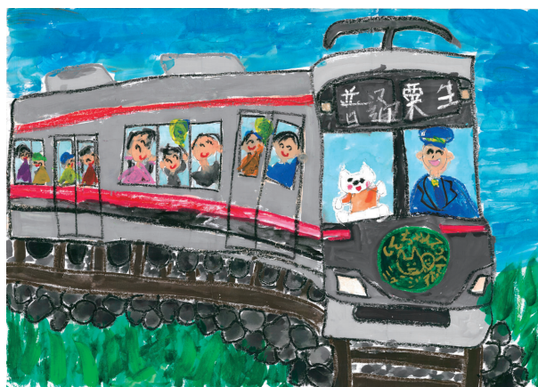
「がんばれしんちゃんてつどう」