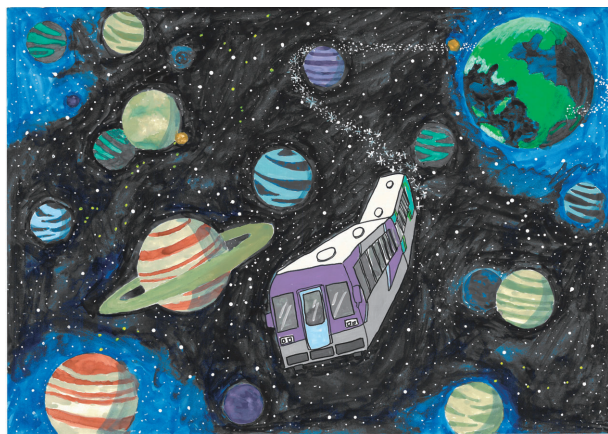
「銀河を旅する北条鉄道」