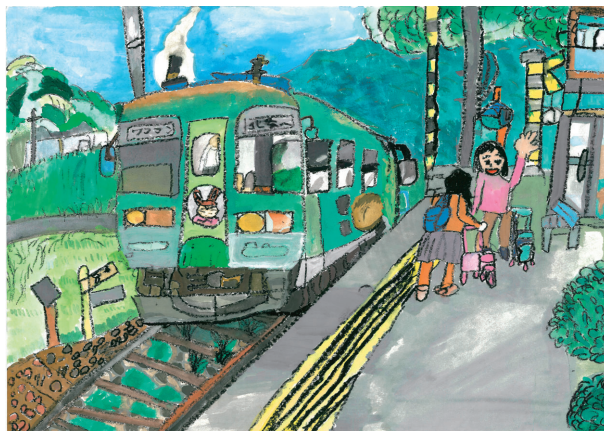
「きれいな風景が見える 北条鉄道」