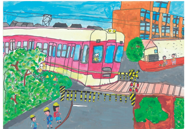
「みんなでなかよくわたろう」