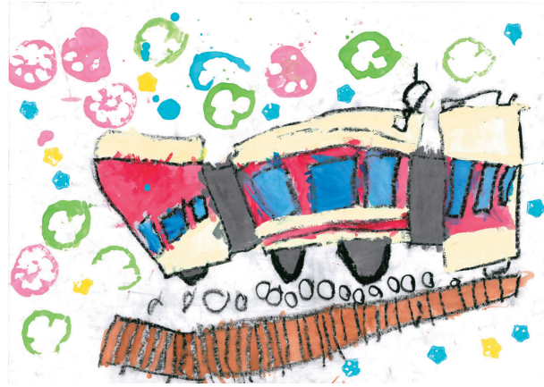
「神鉄電車でシュッ!シュッ!シュッ!」