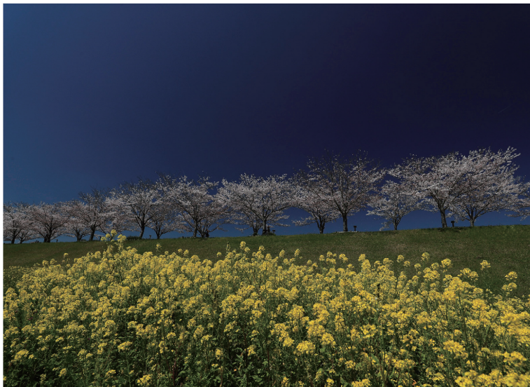
撮影場所：小野市 桜づつみ