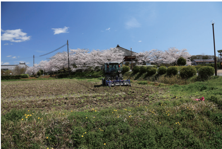
撮影場所：小野市 浄土寺