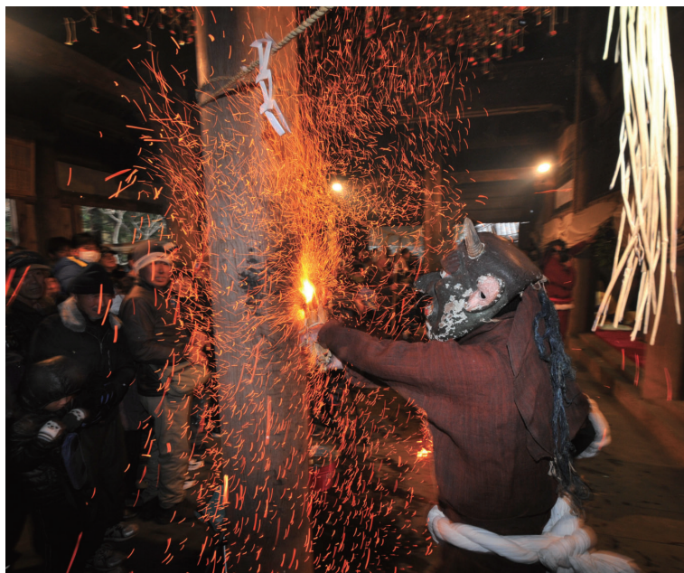
撮影場所：三木市 蓮花寺