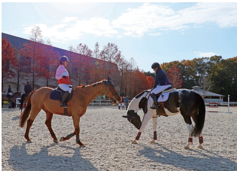
撮影場所：三木市 ホースランドパーク