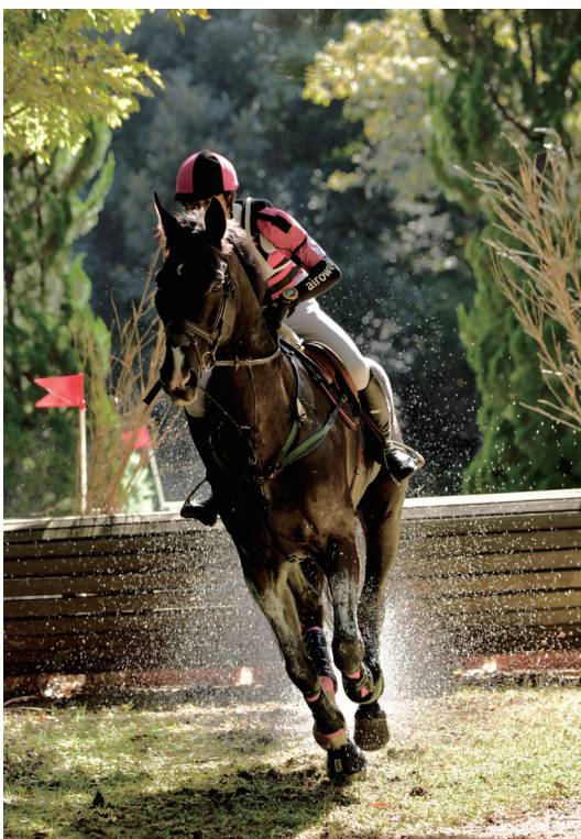
撮影場所：三木市 三木ホースランドパーク

浄土寺は、今から800年前の鎌倉時代初めに建立された寺院です。加古川左岸の小高い丘陵の先端部に位置し、ここから西方を望めば、広大な平地と大きな空が広がっています。春は桜花がとても美しい。