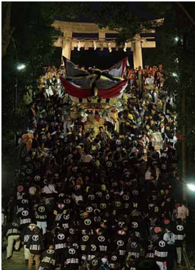
『気合の宮入』 三木市：三木大宮八幡宮 荒木 貞夫