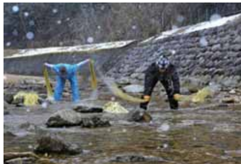
『杉原川の川さらし』 多可町：加美区 都倉 重忠