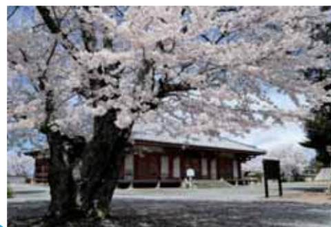
『国宝と桜』 小野市：浄土寺 河合 正雄