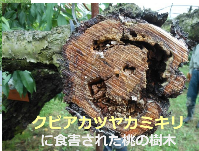
クビアカツヤカミキリ に食害された桃の樹木