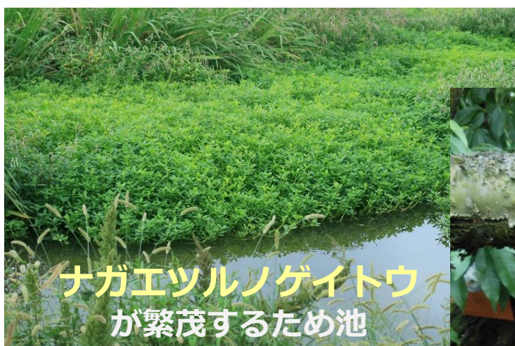
ナガエツルノゲイトウ が繁茂するため池