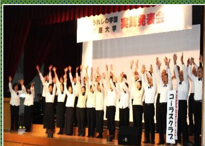
コーラスクラブの発表(昨年)