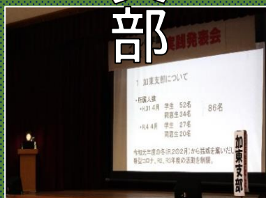
加東支部の発表(昨年)