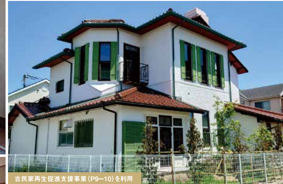
古民家再生促進支援事業 (P9-10) を利用