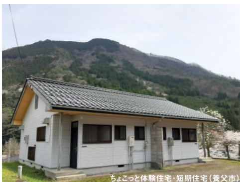
ちよこつと体験住宅・短期住宅(養父市)

一定期間のお試し居住ができる市町の「お試し住宅」。生活体験、物件探しの拠点など、さまざまな目的に利用できます。