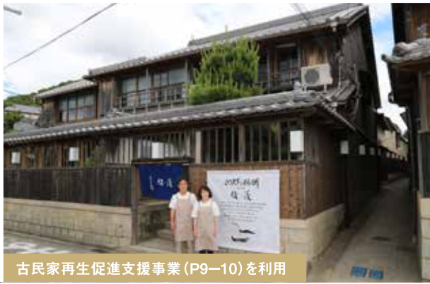
古民家再生促進支援事業 (P9-10) を利用