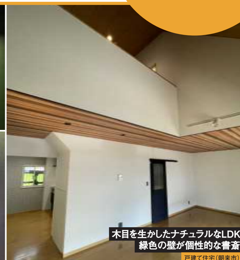
木目を生かしたナチュラルなLDK 緑色の壁が個性的な書斎