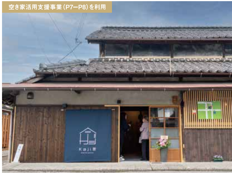
空き家活用支援事業 (P7-P8) を利用