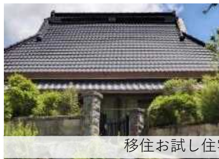
移住お試し住宅（古民家）