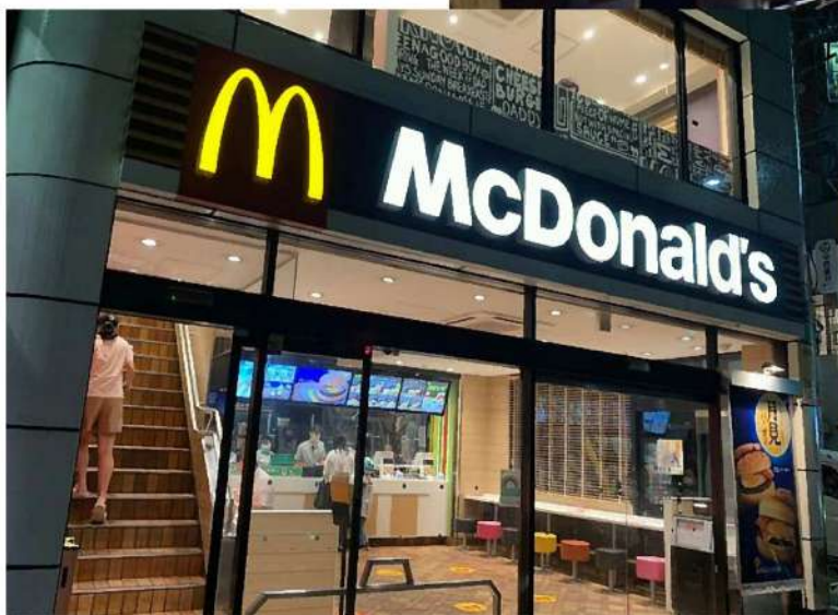
参照・マクドナルド 新世代デザイン店舗