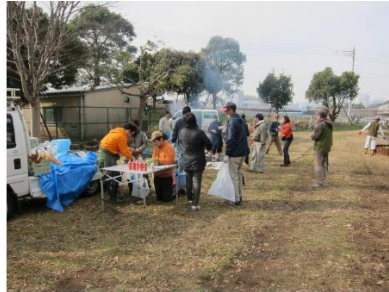
表 手づくり公園まさごの会 活動チーム