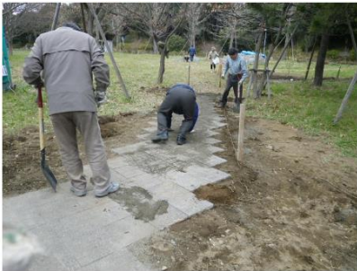
表 手づくり公園まさごの会 活動チーム