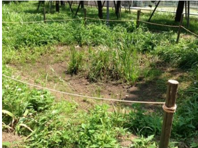
表 手づくり公園まさごの会 活動チーム