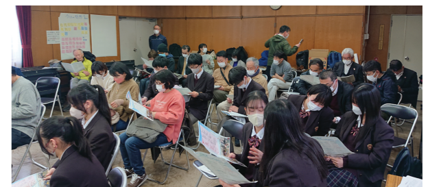
第3回ワークショップの様子

本ワークショップの大きな成果として確認できたことは、多様な関心をもつ人びとが常に対話し、それぞれの活動内容を共有するとともに、学び合い、公園の利用や管理、整備の方策を検討するための「場づくり」が必要であるということです。